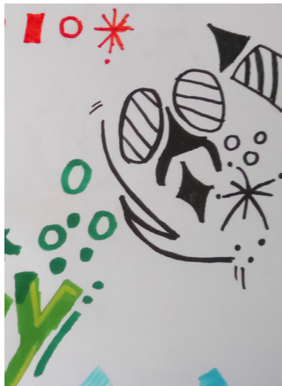
Graffitipajaan osallistuneen nuoren työ.

Se, että asemoiduin pajan osanottajaksi nuorten kanssa, toi minua lähemmäksi muiden osallistujien kokemusmaailmaa. Roolini olisi ollut erilainen, mikäli olisin hallinnut breakdancen liikekieltä jo valmiiksi. Minulla on pitkä tanssitausta, mutta breakdancea en ole koskaan tanssinut. Aloittelijuuteni toi minut lähemmäs pajaan osallistuvien nuorten asemaa, joskin se, että olen pajoihin osallistuvia nuoria vanhempi ja lisäksi tutkija, joka tuntee pajan ohjaajan jo entuudestaan, etäännyttää minua havainnoijana nuorten rooleista pajassa. Havainnoimiini pajoihin on osallistunut hyvin eri-ikäisiä ihmisiä, nuorimman ja vanhimman palautealomakkeen täyttäneen osallistujan välinen ikäero on 14 vuotta. Koska olen itsekin melko nuori, vaihtelee asemani ikäni puolesta osallistujiin nähden aikuisesta vertaiseen. Toisinaan positioni on lähestynyt ohjaajan roolia, joskin eettisesti on tärkeää, että osallistujat tiedostavat minun olevan tutkija. Osallistujien suhtautuessa minuun kuin ohjaajaan, on minulle kertynyt tietoa myös niistä haasteista, joita ohjaaja kohtaa tasapainotellessaan sen kanssa, miten kohdata kaikkien osallistujien tarpeet. Positioiden vaihtelusta ja valtasuhteista huolimatta koen tavoittaneeni osallistumisellani tietoa pajaan osallistuneiden nuorten kokemusmaailmoista (ks. Honkasalo 2018, 190). Edeltävässä katkelmassa kuvatussa tilanteessa kokemani jännityksen