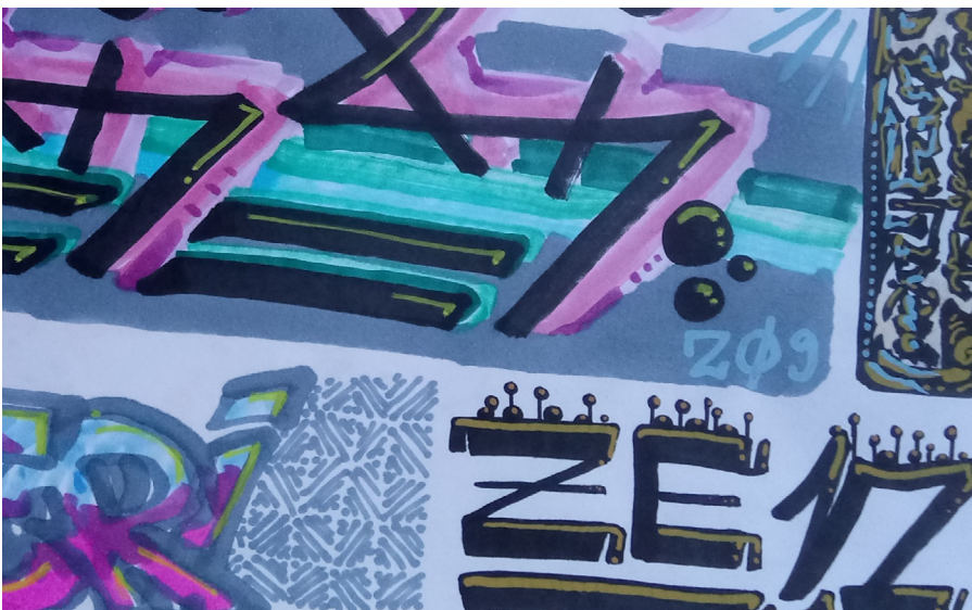
Graffitipajassa osallistuvaa havainnointia tehneen tutkijan työ.

Tutkijan tunteet voivat vaikuttaa osallistuvuuden tasoon havainnoinnissa.