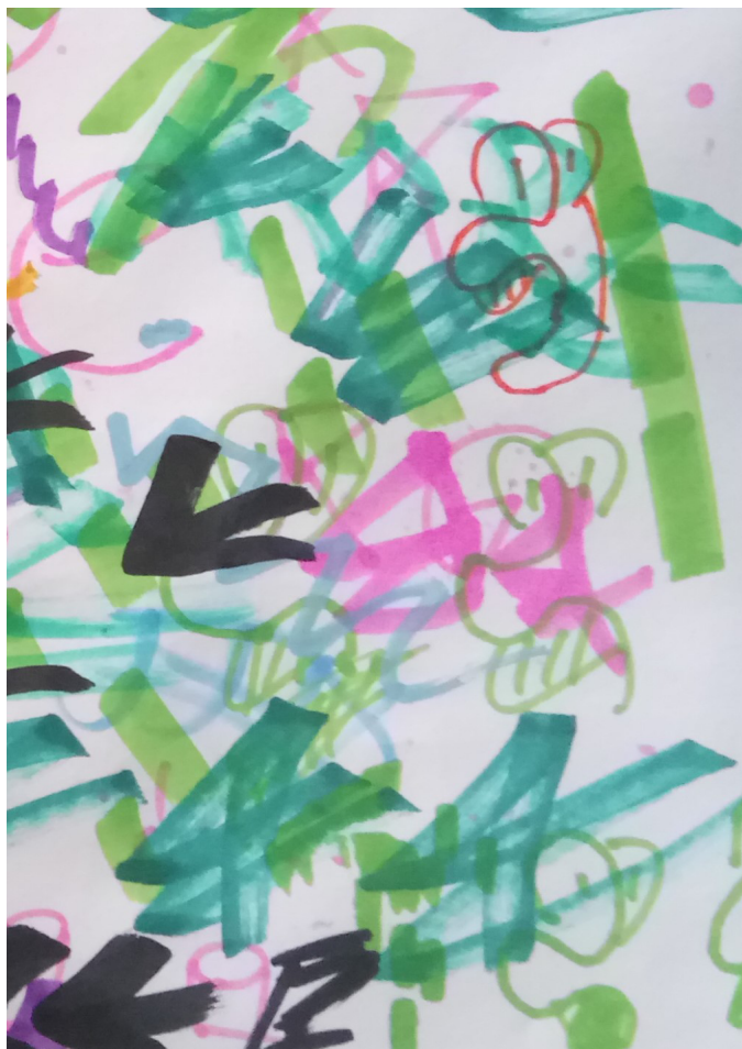
Graffitipajaan osallistuneen nuoren työ.

Lomakevastausten kautta kerätyn aineiston rinnalla tehty etnografinen havainnointi on mahdollistanut paitsi laadullisen arvioinnin tekemisen, myös lomakevastauksia täydentävän tiedon saavuttamisen.